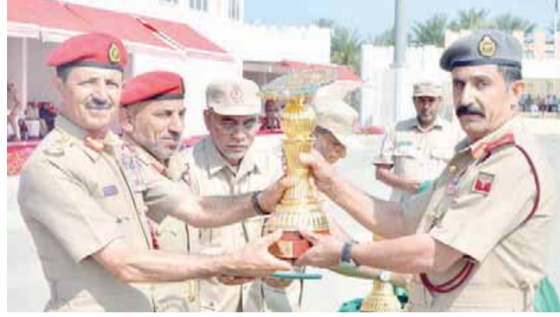
تكريم مولات سلطان عمان