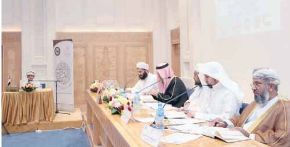
■ اللجنة تستمع لأحد المتسابقين