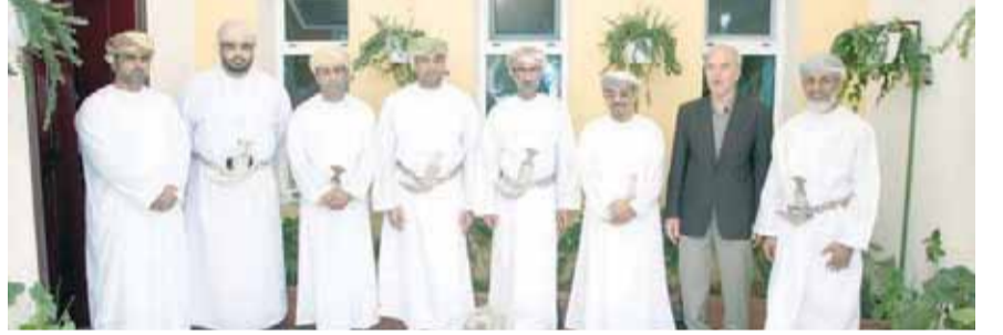
■ من زيارة وزير البيئة للبيت الصديق للبيئة بجامعة السلطان قابوس

العمل في المشروع مشيرا إلى العمل الجماعي الذي شاركت فيه عدة تخصصات وعكست تكاملية العلوم الجهد الجماعي للعديد من الأساتذة والطلبة من أقسام الهندسة المعمارية والمدنية والكهربائية والميكانيكية. إضافة إلى أساتذة وطلبة كلية الزراعة، وفي ختام الزيارة أثنى معالي وزير البيئة والشؤون المناخية على الجهد الكبير لفريق الأساتذة والطلبة وأشار إلى أنه يمكن النظر إلى البيت باعتباره واحة علوم ومحتلة لكل المحتمتمين في القطاع الهندسي والمجتمعي بشكل عام وأن يكون محط الأنظار في المستقبل وأن يكون مفتوحا لكافة التخصصات الهندسية وغير الهندسية لتقديم أفكار مبتكرة وحلول صناعية متقدمة وخدمات بحثية شاملة تخدم الجامعة والكليات والمجتمع العماني بوجه عام.