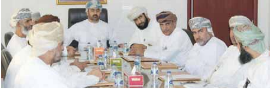
■ من الاجتماع