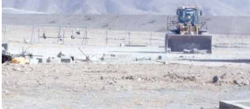
■ جانب من إزالة الحيازات بقيرون حيرتي