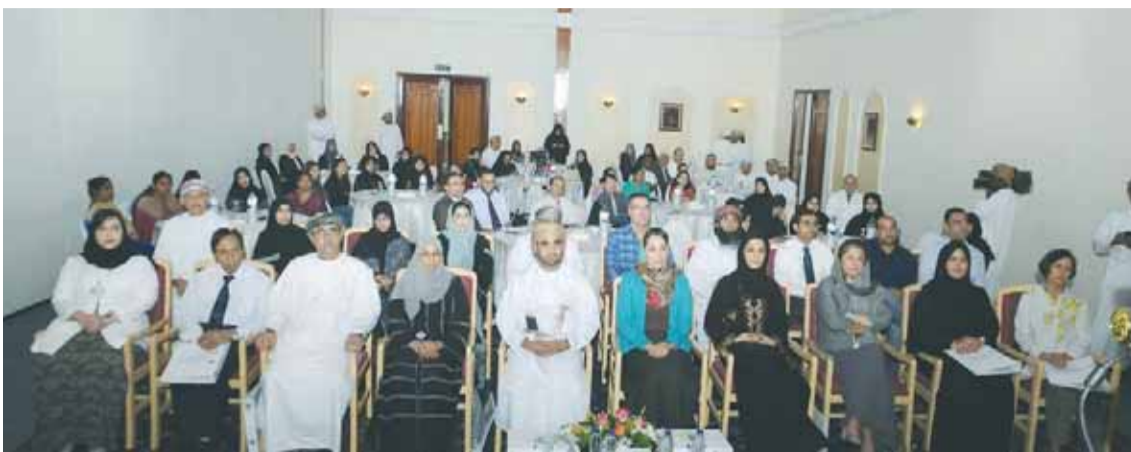
من حضور الحلقة التدريبية لمدربي الرعاية المتكاملة

استقبل المركز التنموي النسوي بولاية السنية سعادة الشيخ فهد بن سلطان البعويبي والي السنية والمكرم الشيخ أحمد بن محمد الشامي عضو مجلس الدولة وعضو مجلس الشورى ممثل الولاية سعادة حمدان المنعي. تناول اللقاء التعريف بالمركز وأهدافه وأنشطته وسبل التعاون المشترك بين المركز والدوائر الحكومية الأخرى في الولاية للارتقاء بمستوى