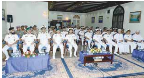
من الحضور في ندوة آفاق الأمن البحري