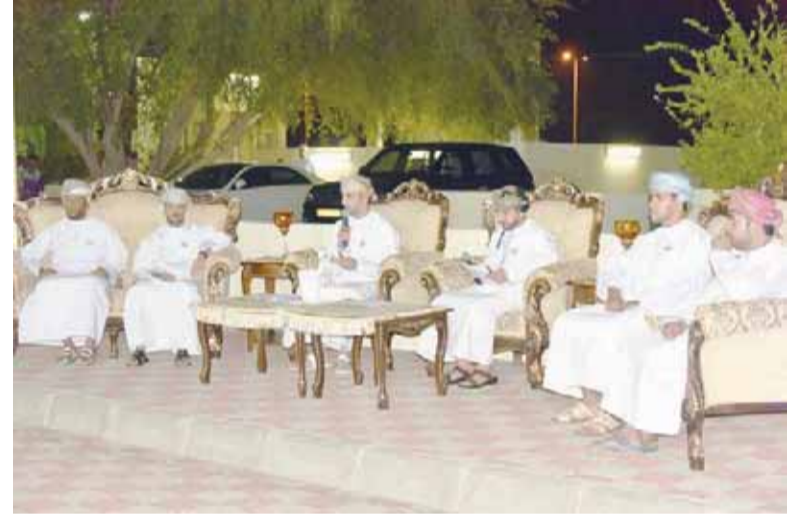
■ خلال الحلقة النقاشية