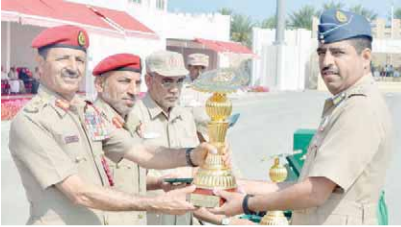
تكريم قاعدة غلا الجوية