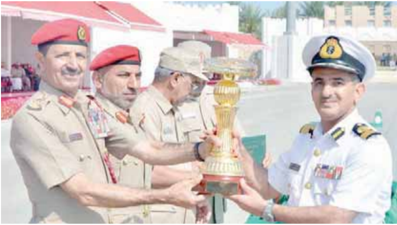
تكريم قاعدة سعيد بن سلطان البحرية

خلال الاطلاع على مخططات مشاريع الخدمات الهندسية