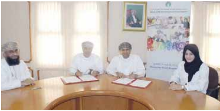
■ توقيع الاتفاقية

لغاز الطبيعي المسال وبحضور بعض المسؤولين من الجهتين.