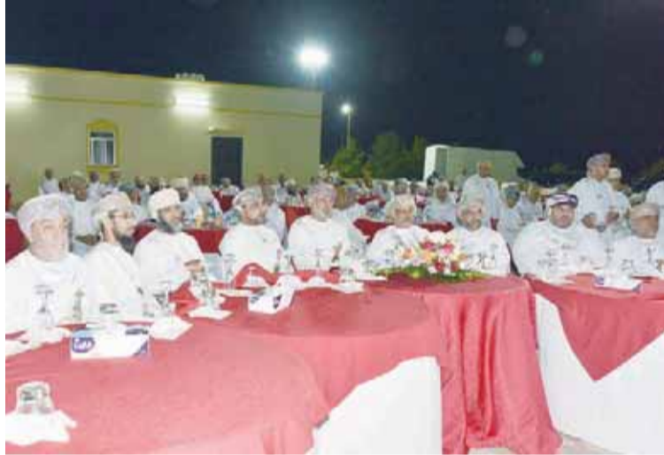
■ من حضور حفل التكريم