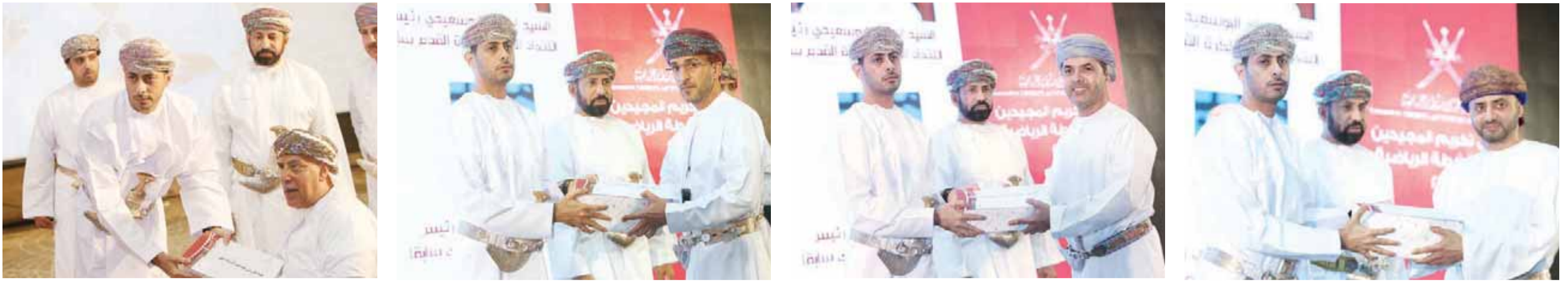
تكریم الرؤساء السابقين