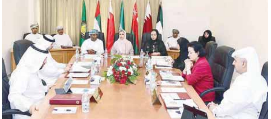
■ خلال اجتماع اللجنة الاشرافية للشبكة الخليجية لضمان جودة التعليم العالي لدول المجلس

التي تصدرها هيئات الاعتماد الأكاديمي بدول مجلس التعاون الخليجي. ويأتي هذا الاجتماع للجنة الاشرافية لمكتب الشبكة الخليجية لضمان جودة التعليم العالي لدول مجلس التعاون لدول الخليج العربية ضمن جهود الدول الأعضاء بمجلس التعاون الخليجي لضمان جودة الحصيلية النهائية في مراحل التعليم العالي بدول المجلس وكذلك تيسير الحصول على مستويات عالية وذات كفاءة لتمكين مخرجات مؤسسات التعليم العالي بدول المجلس من الالتحاق بالدراسات الجامعية في دول المجلس ولتسليمهم بالعلم والتعليم العاليين لخدمة مجتمعاتهم ووطنهم ولدفع مستوى الممارسات الجيدة لضمان الجودة لمؤسسات التعليم العالي بدول المجلس.