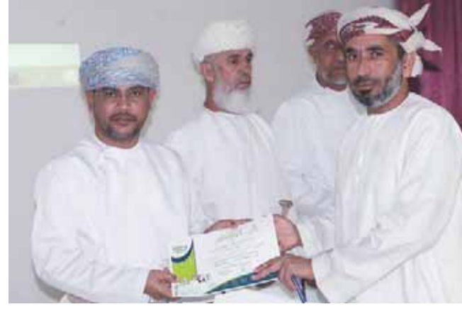
■ من تكريم المعلمين بولاية بديعة

بمحافظة شمال الشرقية حفل تكريم بيوم المعلم وذلك تحت رعاية سعادة الشيخ ماجد بن سلطان الشكيلي والي الولاية بحضور الدكتور سالم بن محمد الحجري خبير تربوي تعليمية شمال الشرقية. وأقيم الحفل بمتكرب الوالي، وبدأ الحفل بكلمة ألقاها سعادة الشيخ راعي الحفل هنا المعلمين والمعلمات بيومهم السنوي شاكرًا على عطائهم ومتمنيا المزيد لخدمة هذا الوطن الغالي ويأتي هذا التكريم لما من أهمية لدور المعلم في بناء الأوطان وتغذية التلاميذ بالعلم والمعرفة. حضر الحفل الشيخ رئيس مجلس الآباء بمدرسة أبو مالك ومديرو ومديرات مدارس الولاية وعدد من الكوادر بهيئة التدريس، وفي نهاية الحفل قام راعي المناسبة بتكريم المعلمين والمعلمات.