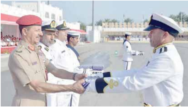
من تكريم الخدمات الهندسية بوزارة الدفاع