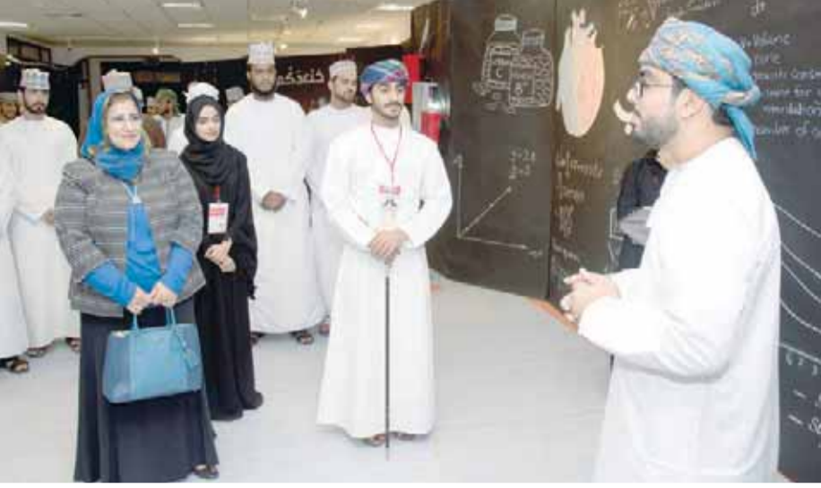
■ من المعرض المنظم بالملتقى

فهم تطبيقات الرياضيات في الحياة ليس فقط في مجالات الكيمياء والفيزياء والعلوم بل تعددت تطبيقاتها لتصل إلى الطب ومجالات أخرى. وجهت الطلبة واضح ولمس في هذا المجال واختيارهم لعنوان حساب اختيار موفق ويعبر عن فكرة الملتقى.