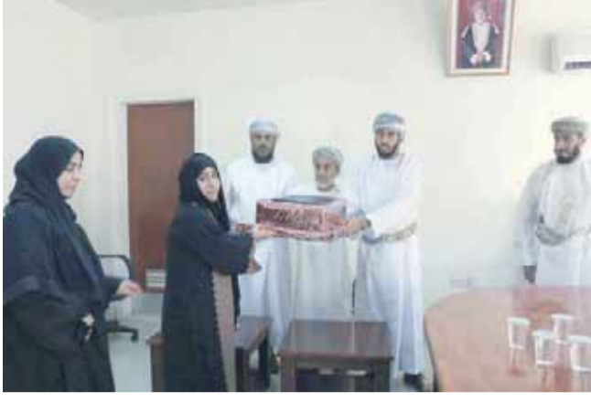
■ من تكريم المعلمات بولاية وادي بني خالد