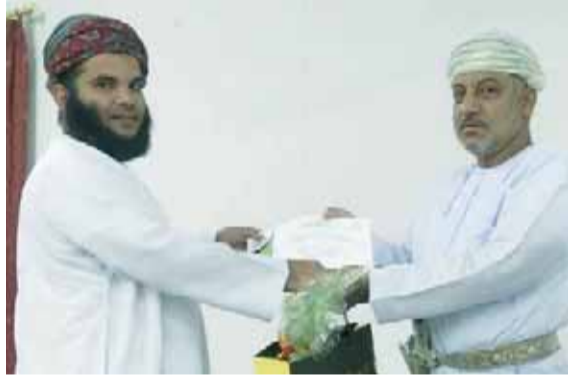
■ من تكريم المعلمين بولاية دماء والطائيين

كما احتفلت ولاية دماء والطائيين بتكريم المعلمين