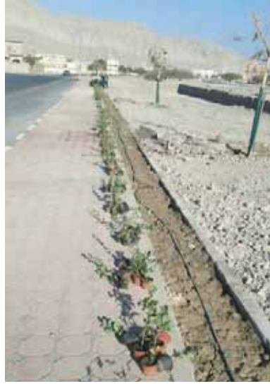
■ جانب من السياج النباتي

وأضاف مدير بلدية خصب: إن البلدية تعمل على مشروع تركيب حوالي (١٤٠) سلة مهملات توزع في الشوارع والطرق الحيوية في الولاية وذلك للحد من إلقاء النفايات في الشوارع وتبعتها مؤكدا بأن البلدية ممثلة بقسم الصحة الوقائية والصرف الصحي تبذل الكثير من الجهود في سبيل تحسين مستوى النظافة العامة في الشوارع والمناطق العامة والشواطئ، كما تواصل البلدية وبصفة مستمرة حملات النظافة العامة بالمناطق البحرية التابعة لبلدية خصب وهي منطقة غصّة، غرم، نظيفي، الفلم، البلد، الحيلين، غب علي، قانة، الحوينية وغيرها من المناطق البحرية حيث تم نقل حوالي (٢٠٠) شحنة من مخلفات النخيل والبناء والخلفات العشوائية مشيرا إلى أن البلدية انتهت حاليا من مشروع عمل مواقف للمركبات وتركيب