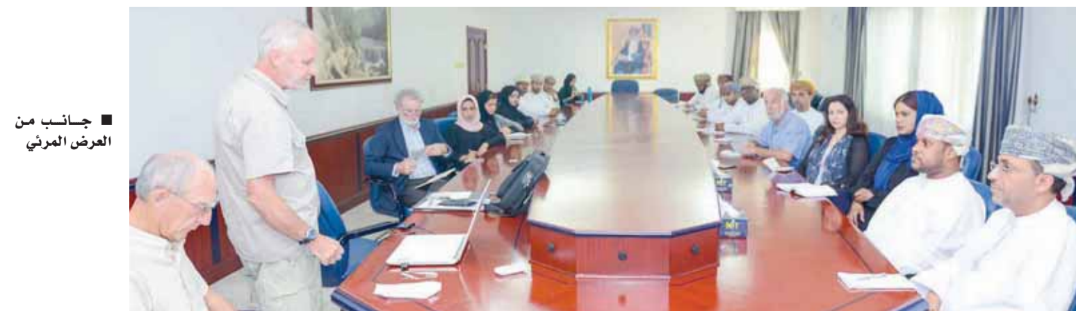
■ العرض المرئي

نظمت وزارة البيئة والشؤون المناخية عرضاً مرئياً لمشروع مسح الطيور الشاطئية والنسور والعقبان في السلطنة يوم امس بديوان عام الوزارة، حيث قدم العرض المرئي الدكتور ميك جرين والدكتور ايان هاريسون خبراء في مجال الطيور، حيث استعرض الخبيران نتائج المسوحات خلال الفترة من ٢٠٠٨ - ٢٠١٧، والتي تبين ارتفاعاً في عدد الطيور الشاطئية التي تزور السلطنة الأمر الذي يعبر عن أهمية شواطئ السلطنة للطيور المهاجرة في ظل تدهور بيئتها وموائلها في عدد كبير من دول العالم الواقعة على خط مسارات هجرة الطيور. كما استعرض الخبيران بيانات مسح النسور والعقبان والذي أوضح انتشارها في مختلف محافظات السلطنة، حيث تم التركيز على بيانات العقاب الذهبي وتواجده ومناطق تكاثره في السلطنة، وقد بين الخبيران بأن هناك