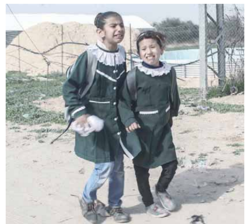
■ طفلتان فلسطينيتان تجريان خوفاً من الغارة الإسرائيلية على رفح جنوب قطاع غزة أمس

غزة - أ ف ب، أصيب أربعة فلسطينيين أمس بجروح في قطاع غزة نتيجة ضربات جوية إسرائيلية أعقبت سقوط قذيفة أطلقت فجر أمس من القطاع على جنوب إسرائيل لم توقع إصابات، حسب ما أعلنت وزارة الصحة في القطاع التابعة لحركة حماس. وتبادل الطرفان الاتهامات إثر هذا التوتر الأمني الجديد.