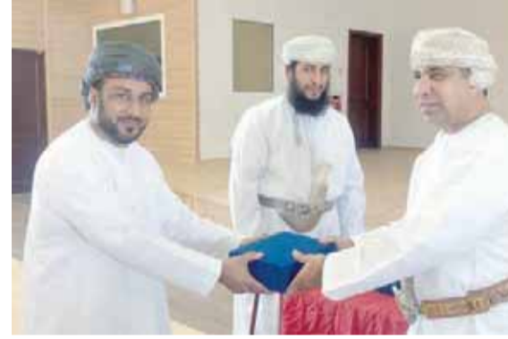
■ من تكريم المعلمين بولاية القابل

مراسلو: عزة - خليفة الحجري - سالم البراشدي - أحمد العمري - محمد الصلحي :