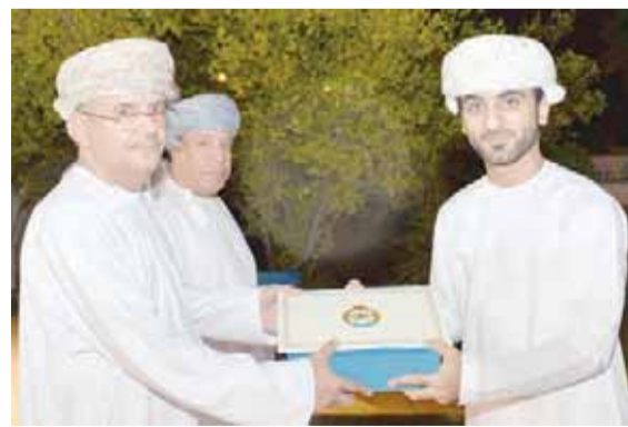
■ من تكريم ضباط التعليم بسلاح الجو

يستهدف هذا البرنامج التدريبي (٤٠) مشاركاً من المشرفين التربويين ومعلمي المدارس العشرين الجديدة المشاركة في هذا البرنامج في مرحلة التوسعة المستمرة، والتي أضيفت في هذا العام، ليصل عددها إلى خمسين مدرسة مطبق لهذا البرنامج؛ وذلك بهدف تأهيل هؤلاء المعلمين لمرحلة متقدمة من التطبيق، وتدريبهم على استخدام بروتوكولات متقدمة، وليكونوا قادرين على تنفيذ برامج تدريبية خاصة بهذا البرنامج، إلى جانب بناء جيل من الطلبة يعمل على رعاية البيئة، وتقديم الحلول العملية المناسبة للتحديات التي قد تواجههم باستخدام أجهزة وقياسات متطورة.