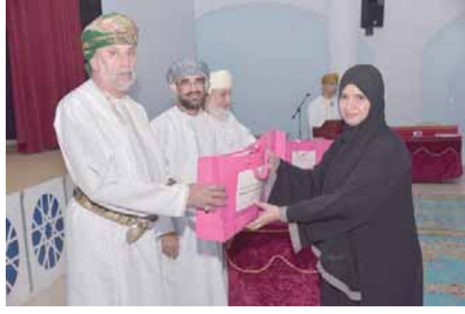
■ من تكريم المعلمات بولاية إبراء