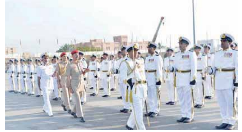
خلال تفتيش الصف الأمامي من طابور الخريجين

احتفلت الخدمات الهندسية بوزارة الدفاع صباح أمس بيومها السنوي الذي يوافق الخامس عشر من فبراير من كل عام، وذلك تحت رعاية الفريق الركن أحمد بن حارث الثبهاني رئيس أركان قوات السلطان المسلحة، واشتمل الحفل على تخريج الدورة التحويلية الأولى للضباط، بالإضافة إلى تخريج دورة ضباط الخدمة المحدودة والذين تلقوا تدريبهم في أكاديمية السلطان قابوس البحرية. وبدأت مراسم الاحتفال الذي أقيم على ميدان الاستعراض العسكري بمسكس المرتفعة بالتحية العسكرية لراعي المناسبة، بعدها أستأذن قائد الطابور راعي الحفل بتفتيش الصف الأمامي من طابور الخريجين، عقب ذلك قدم الضباط الخريجون استعراضاً عسكرياً بالمسير البطيء مروراً من أمام المنصة الرئيسية لميدان الاحتفال.