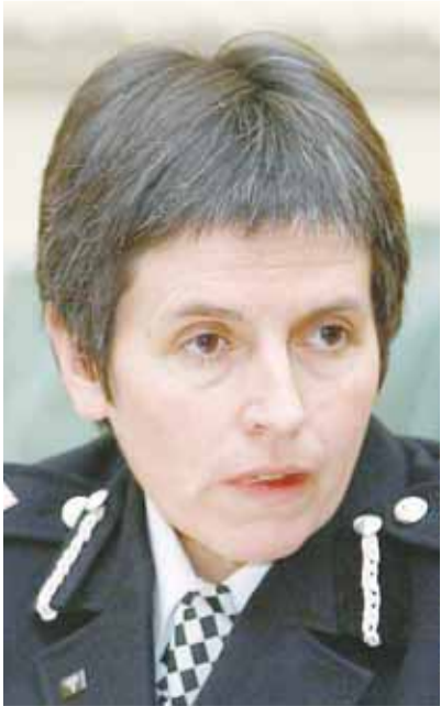
كريسيديا ديك رئيسة جهاز شرطة العاصمة لندن

احتل خبر تعيين كريسيديا ديك مساحات لا بأس بها في الصفحات الأولى لكثير من الصحف البريطانية والعامل، باعتبارها أول امرأة تتولى قيادة جهاز شرطة العاصمة لندن (اسكوتلنديارد) عبر تاريخ الجهاز الممتد إلى ١٨٨ عاما، وستقود قوة قوامها نحو ٤٣ ألفا من الضباط والموظفين، وستحكم في ميزانية تبلغ أكثر من ٣ مليارات جنيه استرليني. حيث أعلنت الحكومة البريطانية عن تعيينها في أرفع منصب في جهاز شرطة العاصمة. لتخلف السير برنارد هوغان-هوي الذي أعلن تقاعده العام الماضي، وهو الذي يتخى عن قيادة شرطة العاصمة هذا الشهر بعد ٥ سنوات في المنصب.