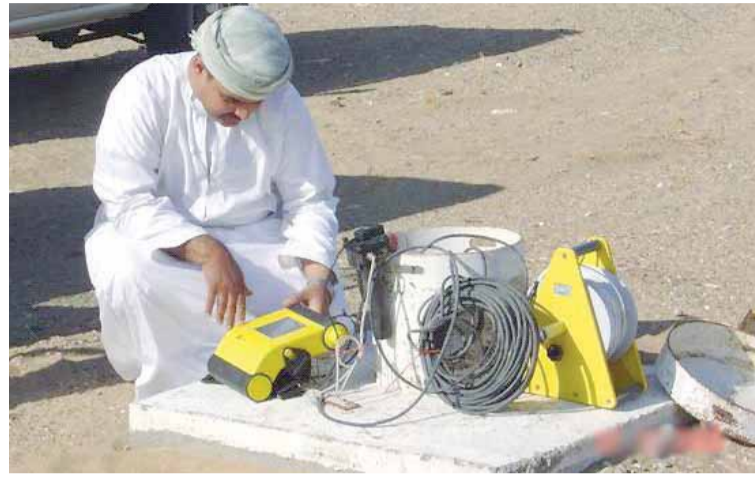
من الأعمال الميدانية

أوضحت نتائج الدراسة التي قامت بها وزارة البلديات الإقليمية وموارد المياه في قياس ملوحة المياه الجوفية من خلال مراقبة التغير في التوصيلية الكهربائية بالأبار الواقعة على امتداد ساحل الباطنة والبالغ عددها حوالي (١٠٠٠) بئر، في زيادة ملحوظة المياه في بعض أجزاء ساحل الباطنة خلال عام ٢٠١٦ مقارنة بعام ٢٠١٥ حيث زادت ملوحة المياه الجوفية بمقدار ٢٥٪ في حوالي (٥١٠) أبار، بالمقابل تحسنت ملوحة المياه في بعض الأبار وبلغ مقدار التحسن في نوعية المياه الجوفية حوالي ١٧٪ في (٤٥٥) بئر. وقد شملت الدراسة المنطقة الواقعة من جنوب ولاية السيب (وادي عيدين) وحتى الحدود الشمالية (شمال ولاية شنانص بوادي ملاح) بطول بلغ (٢٠٠) كيلومتر ويعرض يصل إلى (٦) كيلومترات عند ولاية بركاء، وبلغت إجمالي المساحة التي شملتها الدراسة حوالي (٢٢٩٥) كم ٢ بزيادة قدرها حوالي ١٣٠ كم ٢ مقارنة بالمسح الميداني لعام ٢٠١٠م.