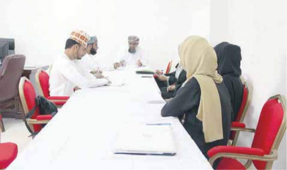
■ من اجتماع المجلس الاستشاري الطلابي بكلية التربية بالرساتق

سيتم استحداث مقررات جديدة تتناسب مع التخصصات الموجودة بالكلية وطرح ٨ تخصصات فرعية في قسم إدارة الأعمال الدولية ابتداء من العام الأكاديمي القادم ، وأيضاً سيتم إقرار مادة تعنى بالتدريب في الشركات والشروط ومعايير معينة والتي سوف الأجر وفق شروط ومعايير معينة والتي سوف تكون بديلاً عن بحث التخرج المعمول به حالياً ، وتم إضافة عدد من الخدمات، وأخيراً تم مناقشة الاقتراحات التي طرحت في الاجتماعات السابقة وما تم تنفيذها والعمل بها .