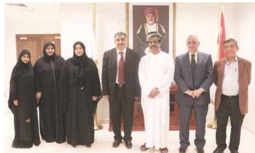
■ جامعة ظفار تكرم طلابها المشاركين في ملتقى الهندسة الكيميائية

نفال فصل على رابع أفضل الأنواع قرابة لتمر المدينة بنسبة ٥٨,٣٨٨% . وحصل تمر نفال هلاي خامس على أفضل الأنواع قرابة لتمر المدينة بنسبة ٣٥,١١٨% . وحصل تمر الفرض على سادس أفضل الأنواع قرابة لتمر المدينة بنسبة ٣٠,٤٥٧% . وحصل تمر الحصاب حصل على سابغ أفضل الأنواع قرابة لتمر المدينة بنسبة ١,٤٧٦% . ويعتبر تمر الخنيزي العماني من أفضل أنواع التمور لاحتوائه على أعلى تركيز من فيتامينات C B١٢ B٦ ، وأعلى تركيز من العناصر المعدنية للفسفور والحديد والصوديوم والزنك والمنغنيز والبيوتاسيوم للوقاية من أمراض نزلات البرد وشلل الأطفال ومستويات الكوليسترول وضغط العين وتصلب الشرايين وبناء الأنسجة والأعصاب والأنزيمات. ويعد مشروع الديزل ابتكار أسلوب علمي جديدة يدخل في مجال تطوير صناعة الديزل لأول مرة عالمياً وقد جرب هذا الابتكار تطبيقياً على المنتج المحلي الديزل العماني، وثبت مختبريا رفع جودته وكفاءته ليصل إلى مستويات عالمية باستخدام مادة محلية