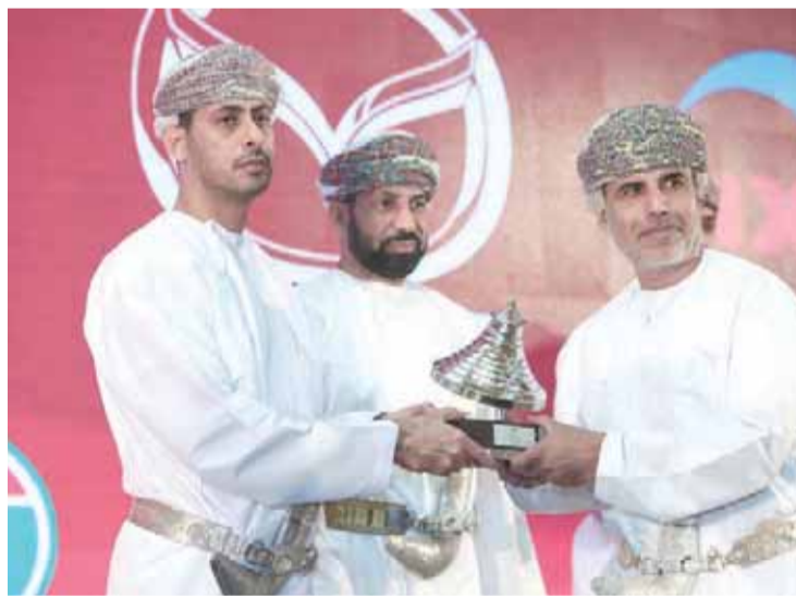
تكریم المؤسسات الداعمة

خسر السلام من الجيش القطري بثلاثة أشواط للا شيء امس في نصف نهائي البطولة العربية للكرة الطائرة المقامة حالياً في البحرين ليتأهل الجيش إلى المباراة النهائية لملاقاة الأهلي البحريني بينما سيلعب السلام مع الريان القطري على المركزين الثالث والرابع. وقدم السلام شوطاً رائعاً وخسره ٢٣/٢٥ قبل أن يتراجع في الشوط الثاني الذي خسره بسهولة ٢٣/٢٥ وحاول وفي الشوط الثالث تعديلاً لنتيجة لكنه خسر أيضاً ٢٥/٢٢.