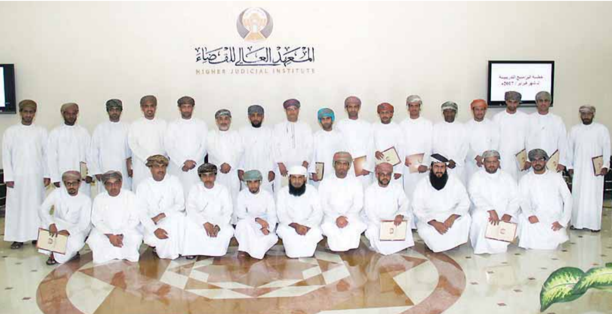
المشاركون في برنامج المعهد العالي للقضاء

للتحقيق، واختتم المحور الأول بالإجراءات الواجبة اتباعها في حال تشكيل المحافظة الإدارية لجريمة جنائية. بينما جاء المحور الثاني للحديث عن التعريف بالمساءلة الإدارية وأهميتها، والحديث عن تشكيل مجلس المساءلة الإدارية، وشروط وإجراءات المساءلة الإدارية، وأيضاً التظلم من قرارات مجلس المساءلة الإدارية وفي الأخير إجراءات المجلس المركزي للمساءلة الإدارية والتظلم من قراراته.