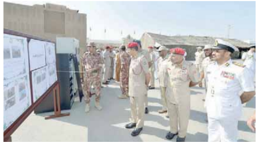
خلال الاطلاع على مخططات مشاريع الخدمات الهندسية