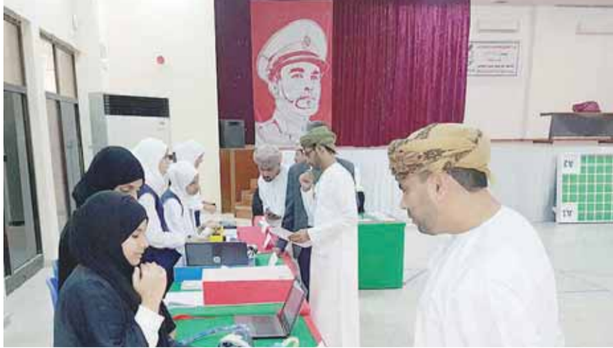
استعراض بعض المشاريع الطلابية

العلمية تلك المشاريع في العلوم التطبيقية والرياضيات. والطاقة والنقل والأنظمة الهندسية إلى جانب الإدارة والعلوم البيئية وعلوم الحاسب الآلي والعلوم الاجتماعية والسلوكية. يذكر أن تقييم مسابقة السومو ومسابقة الحرة سيتم غدا، بينما يتم تقييم مسابقة تتبع الخط ومسابقة جمع الكرات اليوم الذي يليه.