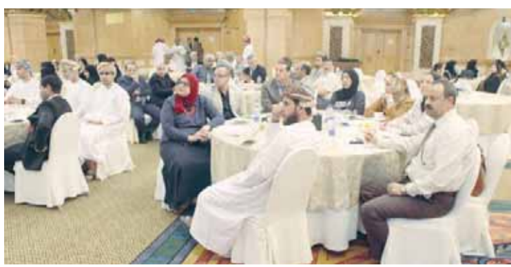
■ حضور اليوم المفتوح