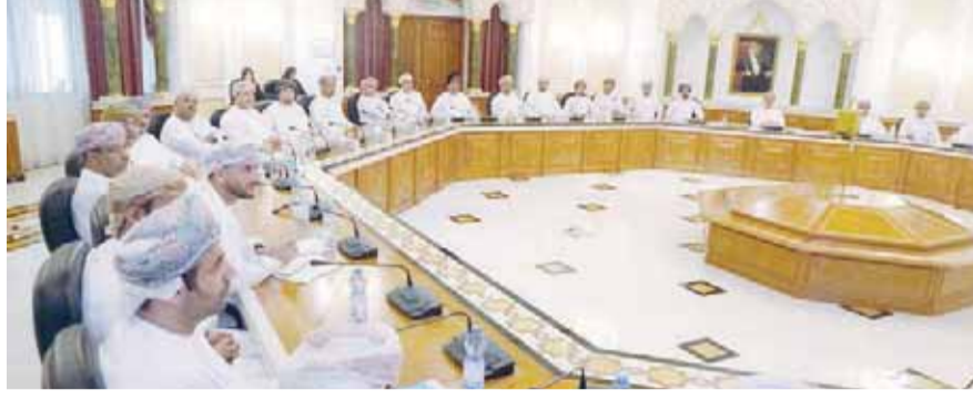
■ جمع من المسؤولين والمعنيين بالبلدية خلال متابعة الحلقة

في المديرية العامة ومتابعة الاشتراطات الصحية لمنح التراخيص البلدية للباعة المتجولين. ودعا توحيد الإجراءات والقرارات في مختلف مديريات البلدية ومناقشة إمكانية وضع هيكل تنظيمي لأقسام التفتيش مبني على التخصص الرقابي ودراسة وضع هيكل تنظيمي لأقسام الشؤون القانونية مبني على التخصص في العمل القانوني، إضافة إلى أهمية حوسبة ضبط المخالفات ومتابعتها.