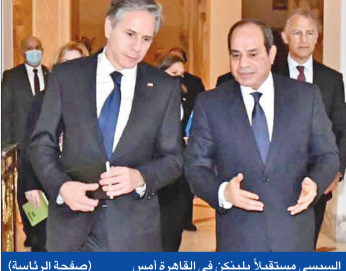
السيسي مستقبلاً ببلينكن في القاهرة أمس (صفحة الرئاسة)

كشف رئيس المكتب السياسي لحركة حماس إسماعيل هنية، أمس، أن الرسالة وصلت إلى الأميركيين والإسرائيليين بأن المقاومة الفلسطينية "ستحدد قواعد الإنشباك في غزة وأدخلت القدس ضمنها وأن القدس خط أحمر"، مؤكدة أن "معركة سيف القدس جعلت اتفاقات أوسلو والتنسيق الأمني ومشروع المفاوضات خلف الظهر". وقال هنية لقناة "الجزيرة": "سدودنا صلبة قوية جداً لصقعة القرن، وأظهرنا زيف التطبيع وبناء التحالفات مع إسرائيل، والأداء العسكري للمقاومة كان مشرفاً وفرض معادلات غاية في الأهمية، وفاجأ الصديق والعدو في الأداء والمزاوجة بين التحرك السياسي والعسكري، أما الأضرار فكانت ثانوية ولم تنل من البنية الصلبة للصائل، وما يسمونه مترو حماس أسمىها المدينة الجهادية وهي سليمة والإسرائيلي لم يصل إلى بنيتها الأساسية". وشدد على أنه "أقننا خطة إسرائيل للنيل من قدرات المقاومة وشبكة الاتفاق في غزة، وتقديرنا أنه لم يكن هناك قرار إسرائيلي