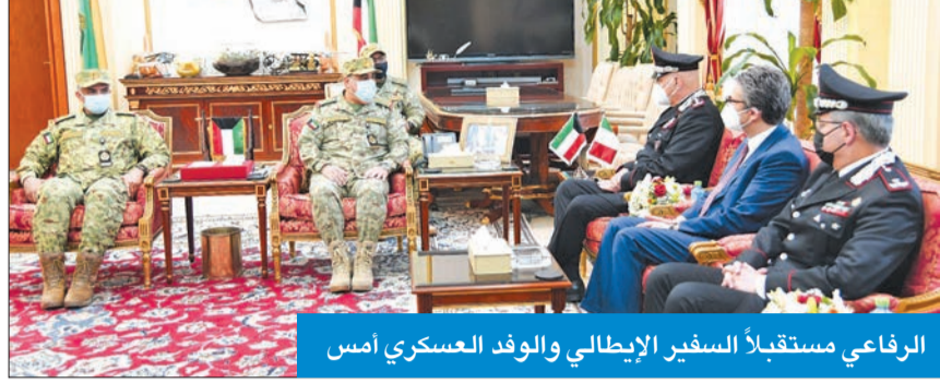
الرفاعي مستقبلاً السفير الإيطالي والوفد العسكري أمس

استقبل وكيل الحرس الوطني الفريق الركن مهندس هاشم الرفاعي، سفير جمهورية إيطاليا الصديقة لدى البلاد كارلو بالدوتشي، برفاقه وفد عسكري برئاسة اللواء أنزو بيرنارديني نائب القائد العام لقوات الدرك الإيطالية «الكارينيري» ويضم العميد قوسيمبي ديريغي والعميد نيكولا كونفورتي والقيب ميناتو مانفيري، وبحث الجانبان تطوير التعاون المشترك بين الحرس الوطني وقوات الكارينيري.