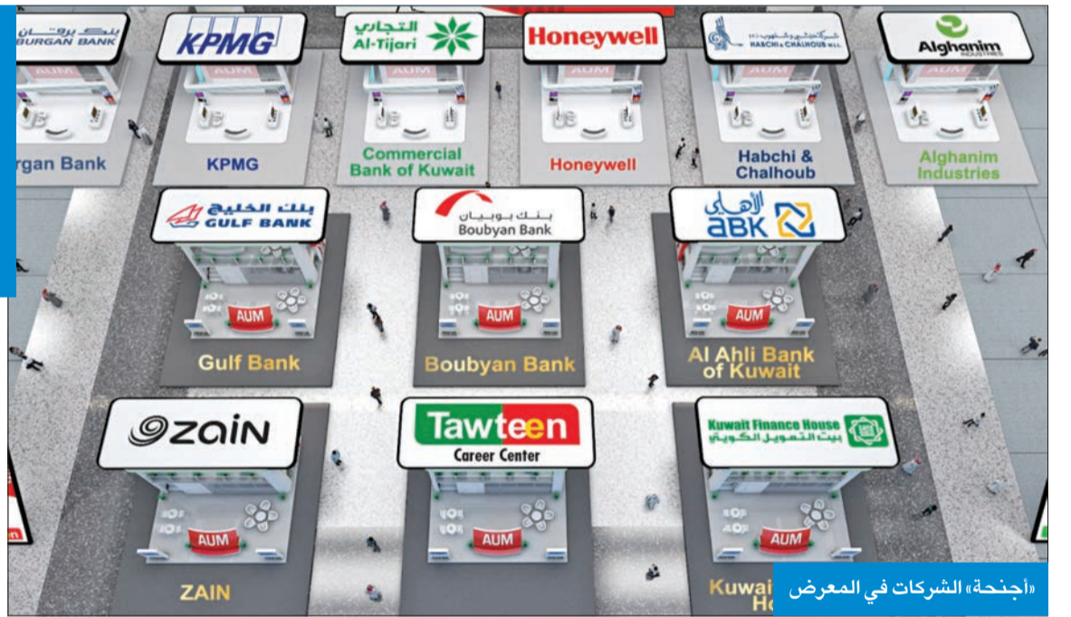
«أجنحة» الشركات في المعرض

تميز معرض التوظيف في جامعة الشرق الأوسط الأمريكية بطرح فرص عمل عديدة ومتنوعة، كما شهد مشاركة زخم من الشركات بما يقارب 40 شركة ومؤسسة محلية وإقليمية وعالمية من مختلف المجالات لاسيما في قطاعات النفط والهندسة والمصارف والاتصالات، منها على سبيل المثال لا الحصر: هانوبيل، شلمبرجير، إيجيبيتي، هالبيرتون، شركة نفط الكويت، زين للاتصالات، بيت التمويل الكويتي، بنك بويان، بنك الخليج، بنك الاهلي الكويتي، صناعات الغانم، البنك التجاري، شركة حبشي وشلهوب، KPMG، بنك برقان، إس تي سي، إنجاز (الكويت)، سيتي بنك، وإرنست ويونغ.