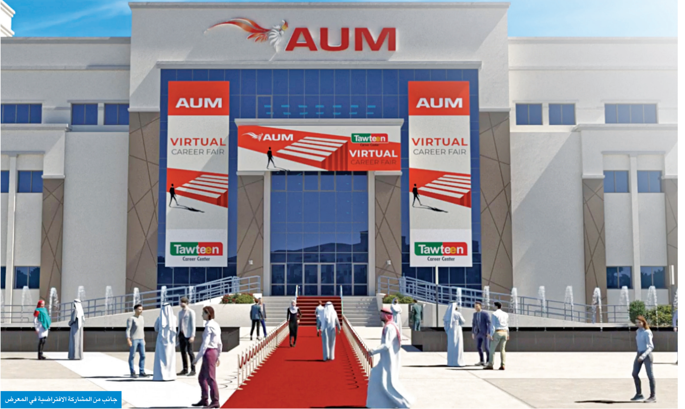
جانِب من المشاركة الافتراضية في المعرض

وقد شهد المعرض إقبال وحضور الآلاف من طلبة AUM وخريجيه، الذين تفاعلوا وتواصلوا مع ممثلي الشركات من خلال منصة ديناميكية مصممة بطريقة تحاكي معارض التوظيف الواقعية، حيث أتاحت لهم