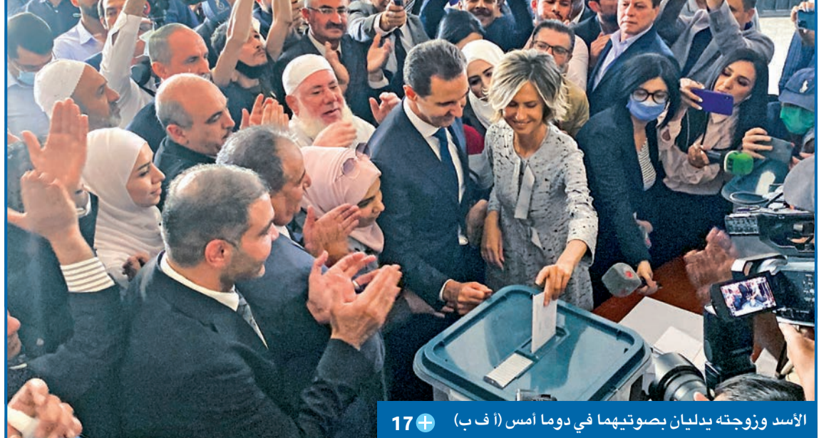
الأسد وزوجته يدلان بصوتيهما في دوما أمس 17