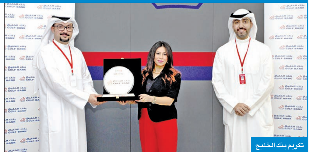
تكريم بنك الخليج

أشاد ممثلو الشركات بالمستوى الأكاديمي وبالمهارات العملية التي يمتلكها طلبة وخريجو جامعة الشرق الأوسط الأمريكية، والتي تميزهم عن غيرهم من الطلبة والخريجين، كما أعربوا عن حرصهم على المشاركة في المعرض لتعزيز التواصل مع الشباب الطموحين الواعدين من خريجي AUM، إيماناً منهم بأن AUM إحدى أهم الجامعات التي تلبى الكثير من احتياجات سوق العمل من خلال خريجيه المتميزين.