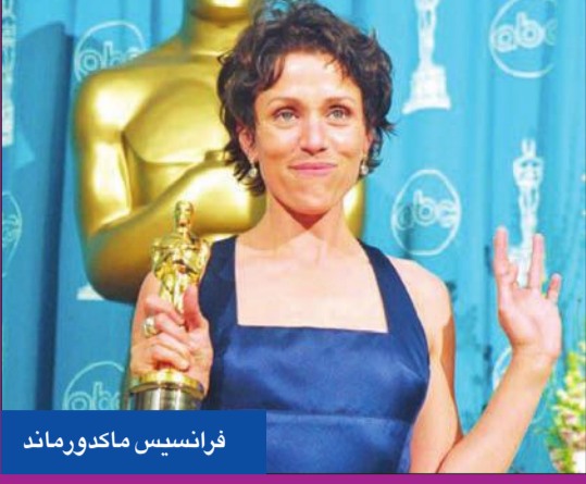
فرانيسيس ماك دورماند

تطلق نسخة سينمائية جديدة متخمة بالنجوم مقتبسة من المسرحية التي ألفها وليام شكسبير بدور العرض في وقت لاحق من العام الحالي قبل بثها على منصة "Apple TV+". وأعلنت خدمة البث الترفيقي "Apple TV+"، أن الممثلة فرانيسيس ماك دورماند (63 عاماً)، والممثل دينزل واشنطن (66 عاماً)، سوف يقومان بطولة فيلم "مأساة ماكبت"، الذي ستقوم بإنتاجه شركتا "ستديو إيه 24" وإبل أوريجينال فيلمز. والفيلم من إخراج جويل كوين، الذي غالباً ما يعمل مع زوجته ماك دورماند، التي فازت بجائزة أوسكار أفضل ممثلة عن فيلم "توماند لاند" في نهاية أبريل. تدور مأساة ويليام شكسبير، الصادرة عام 1606، حول جنرال يتوق للسلطة، ويفتقر إلى الضمير، ويجسده هنا واشنطن، الذي تُوّجح طموحاته لأن يصبح ملكاً لاستكتلندا زوجته اللبدي ماكبت، وتحشد هنا ماك دورماند. وهذه المسرحية بين أكثر أعمال شكسبير التي تم اقتباسها وتحولها لأفلام من جانب أورسون ويلز في عام 1948 ورومان بولانسكي في 1971 والمخرج الأسترالي جاستين كارتزل في 2015 مع مايكل فاسباندر وماريون كوتيار.