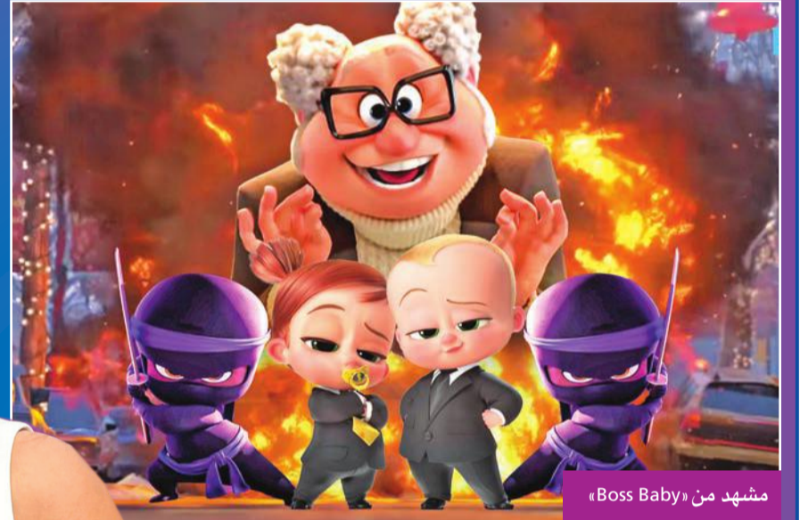
مشهد من «Boss Baby»

استقر صناع الجزء الثاني من فيلم Boss Baby على طرحه في دور العرض حول العالم، وعرضه على إحدى قنوات العرض الأميركية المدفوعة، في نفس الوقت، وذلك يوم 2 يوليو المقبل.