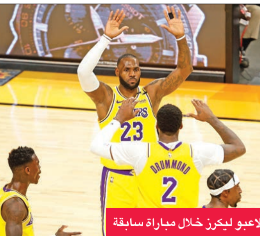
لاعب ليكرز خلال مباراة سابقة

عليه 2-صفر، وسجل النجم 39 نقطة لضع مافريكس في السلوفيني لوكا دونتشيتش المقدمة بفوزه 127-121.