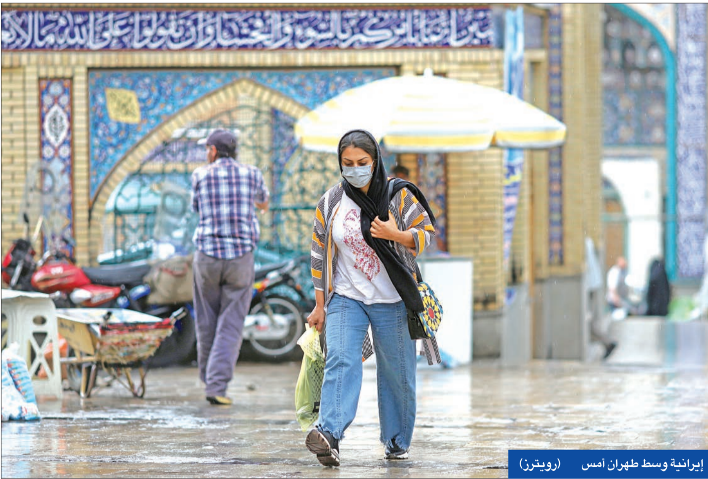
إيرانية وسط طهران أمس

● رئيسي ممتعض ولا يرغب أن يكون «رئيساً مُعيَّناً» ● الأمن يحاصر منزل نجاد ويقيّد اتصالاته