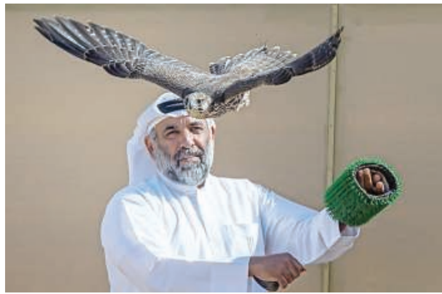
من منافسات بطولة فزاع

شهدت منافسات مسابقة الصيد بالصقور للخليجين مشاركة واسعة من صقارة دول مجلس التعاون بدول الخليج العربي والتي عبر عنها مشاركة 200 صقر، حيث كانت دولة قطر