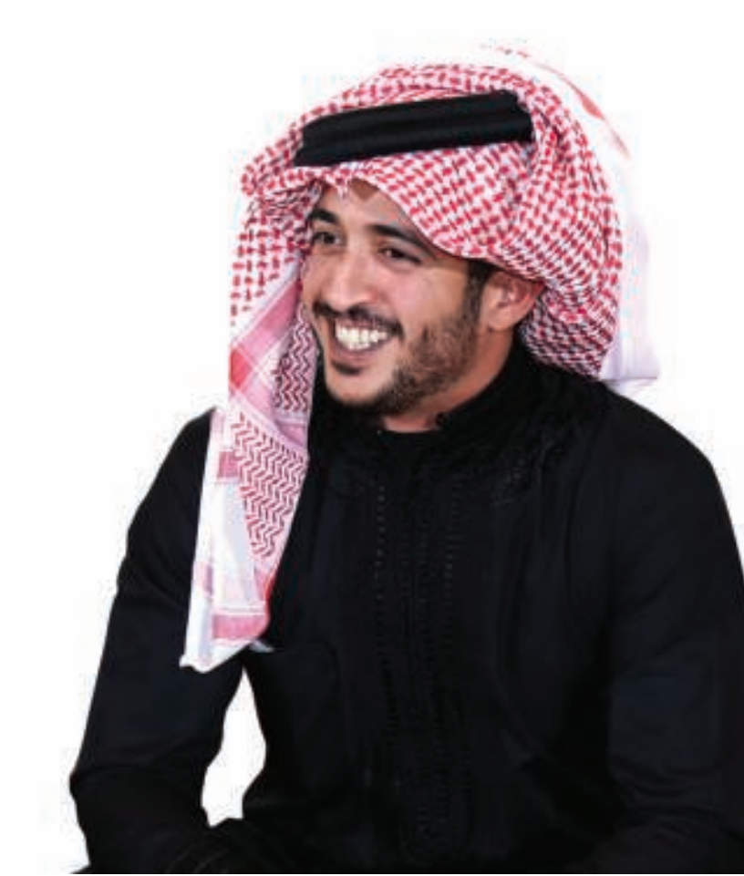
سمو الشيخ خالد بن حمد آل خليفة