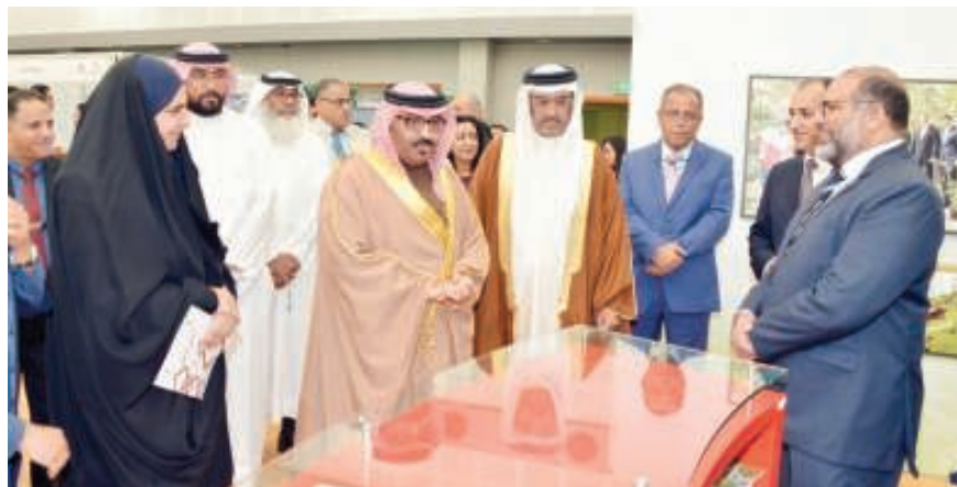
جانب من المعرض

ضمن مشاركتها الهادفة لدعم البيئة والتنمية المستدامة