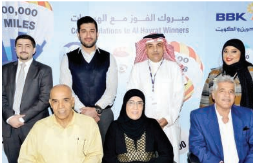
صورة جماعية للفائزين مع إدارة بنك البحرين والكويت

الداخلي والرقابة الداخلية والتسويق والخدمات المصرفية للأفراد في بنك البحرين والكويت. وقد أعرب الفائزون عن فرحتهم بالفوز بالجوائز النقدية كما إنهم صرحوا عن خططهم لإعادة الاستثمار في حسابات الهيئات من أجل زيادة فرصهم في الفوز مرة أخرى مع الهيئات في عام 2017.