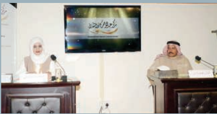
خلال حفل التدشين