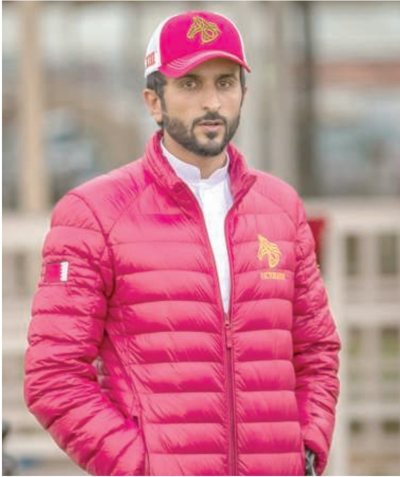
سمو الشيخ ناصر بن حمد آل خليفة

وسيقام اليوم الفحص البيطري الخاص بسباق سمو الشيخ