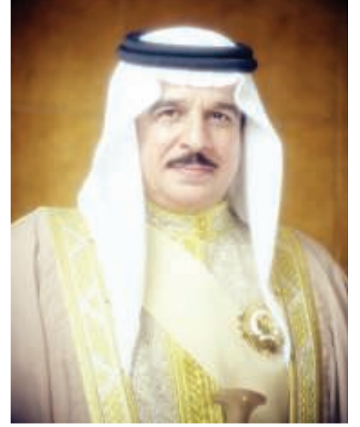
جلالة الملك المفدى

وجاء في القانون أنه لا يجوز إنهاء خدمة الموظف أو العامل البحريني بسبب إصابته بالفيروس، كما لا يجوز حرمانه من العمل طالما أن باستطاعته القيام به. ويكون له الحق في التعليم ويحظر نقله أو فصله من المدارس.