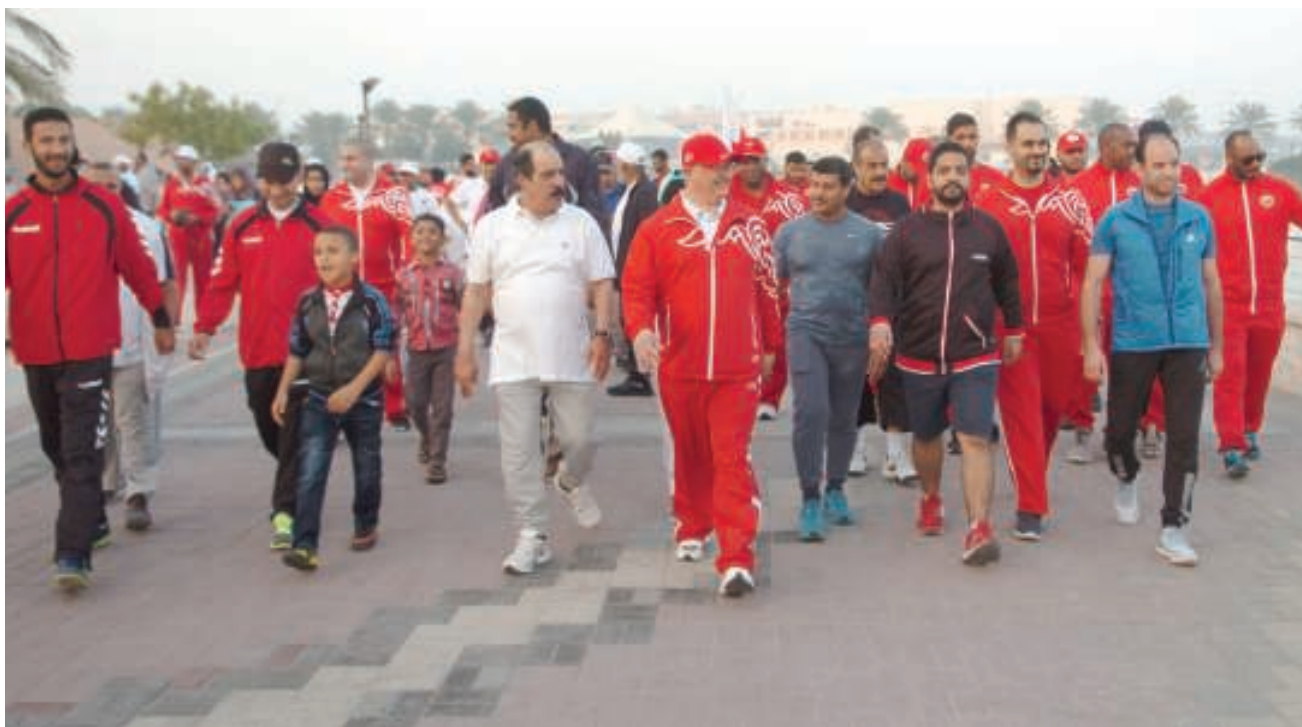
عسكر يتقدم المشاركين في المشي

تعزيز الصحة بركن خاص تضمن مجموعة من الإرشادات والنصائح الصحية، كما شارك مستشفى الهلال الذي قام موظفوه بإجراء بعض الفحوصات الطبية البسيطة للمشاركين.