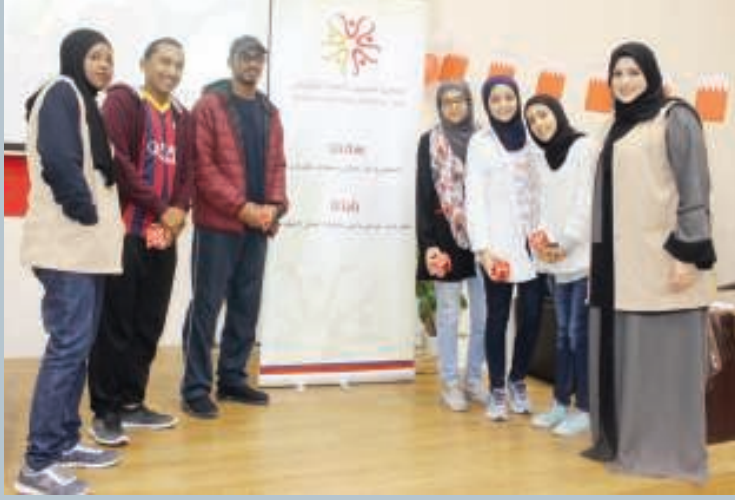
المشاركون في الفعالية