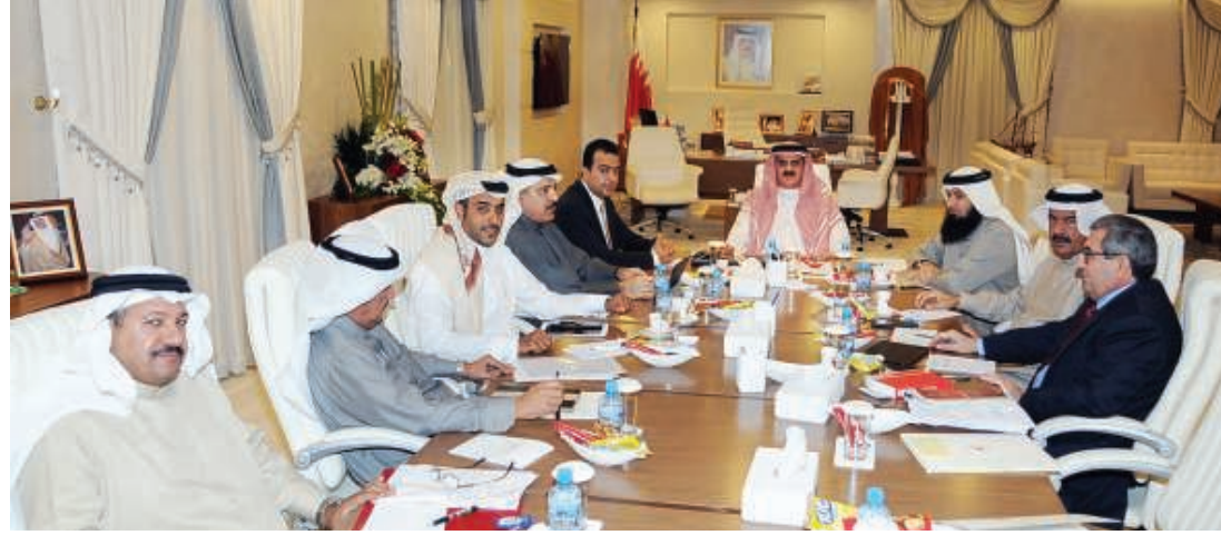
من اجتماع هيئة مكتب النواب

لجنة الشؤون التشريعية والقانونية بخصوص الاقتراح بقانون بتعديل المادة (34) من قانون الإجراءات أمام المحاكم الشرعية الصادر بالمرسوم بقانون رقم (26) لسنة 1986، وتقرير لجنة الشؤون المالية والاقتصادية بخصوص الاقتراح بقانون (بصيغته المعدلة) بإضافة مادة جديدة برقم (5 مكرراً) إلى المرسوم بقانون رقم (10) لسنة 1992 بشأن الوكالة التجارية، وتقرير لجنة الشؤون الخارجية والدفاع والأمن الوطني بخصوص الاقتراح بقانون (بصيغته المعدلة) بتعديل الفقرة الثالثة من المادة (56) من القانون رقم (23) لسنة 2014م بإصدار قانون المرور، وتقرير لجنة الشؤون التشريعية والقانونية بخصوص الاقتراح برغبة بشأن منح مرافق المرضى - الأقارب من الدرجة الأولى - الموظفين إجازة براتب لمدة شهر داخل البحرين وبما لا يجاوز أربع شهور خارج البحرين، وتقرير لجنة الشؤون المالية والاقتصادية بخصوص الاقتراح بقيام وزارة الصناعة والتجارة بإلزام محلات بيع اللحوم والمطاعم والمحللات التي تقوم ببيع الوجبات بالإعلان عن مصدر اللحم التي تستخدمها وحالتها وبلد منشأها، وتقرير لجنة الشؤون الخارجية والدفاع والأمن الوطني بخصوص الاقتراح بتقديم مكافأة فورية ومجزية لكل مبلغ عن تاجر أو مروج مخدرات يثبت صحة التبليغ على أن تبدأ المكافأة من 500 دينار، وتقرير لجنة الخدمات بخصوص الاقتراح برغبة بتخفيض رسوم الدراسات العليا لطلبة جامعة البحرين، وتقرير لجنة الخدمات بخصوص الاقتراح برغبة باعتماد استراتيجية زراعة الكلى لمرضى الفشل الكلوي، وتقرير لجنة المرافق العامة والبيئة بخصوص الاقتراح بتحديد ساعات عمل المحلات التجارية، وتقرر عرض التقارير على المجلس في الجلسات المقبلة.