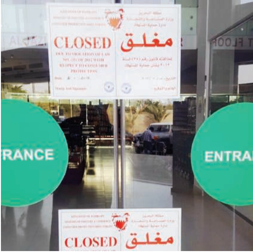
إغلاق برادات الجزيرة فرع الجنبية بعد مخالفة قانون حماية المستهلك