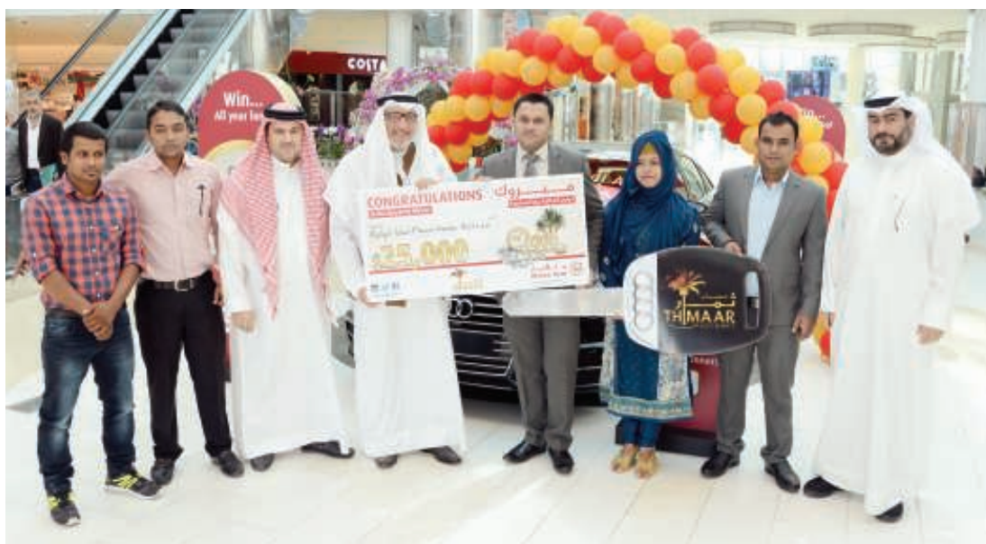
الفائز يتسلم الجائزة

نفسه عن أسماء 187 رابحاً في السحوبات، حيث حصل رابع آخر على الجائزة الشهرية التي تبلغ قيمتها 10 آلاف دولار أمريكي، وحصل 93 رابحاً من أصحاب حساب ثمار