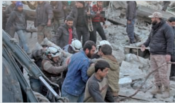
عناصر الدفاع المدني ينتشلون جثث ضحايا قصف جيش الأسد على بنش بريف إدلب

واشنطن - (أ ف ب): فرضت الولايات المتحدة للمرة الأولى عقوبات على 18 مسؤولاً كبيراً في النظام السوري في إطار قضية استخدام أسلحة كيميائية من قبل قوات الرئيس بشار الأسد بحسب بيان صادر عن البيت الأبيض. وقال آدم زوبن المكلف مكافحة تمويل الإرهاب في وزارة الخزانة الأمريكية إن «استخدام أسلحة كيميائية من قبل النظام السوري ضد شعبه هو عمل شنيع ينتهك الممارسة المتبعة منذ فترة طويلة في العالم بأسره بعدم صنع أو استخدام أسلحة كيميائية».