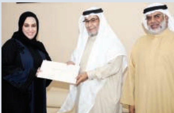
وزير شؤون المجلسين مكرما عدداً من الموظفين

أكد وزير شؤون مجلسي الشورى والنواب غانم البوعينين الاهتمام والرعاية التي تتلقاها المرأة البحرينية من القيادة ودور صاحبة السمو الملكي الأميرة سبيكة بنت إبراهيم آل خليفة رئيسة المجلس الأعلى للمرأة في تمكين المرأة البحرينية في شتى مجالات العمل في القطاعين الحكومي والخاص وسعي سموها للحفاظ على حقوقهن ودعمهن في أداء واجباتهن.