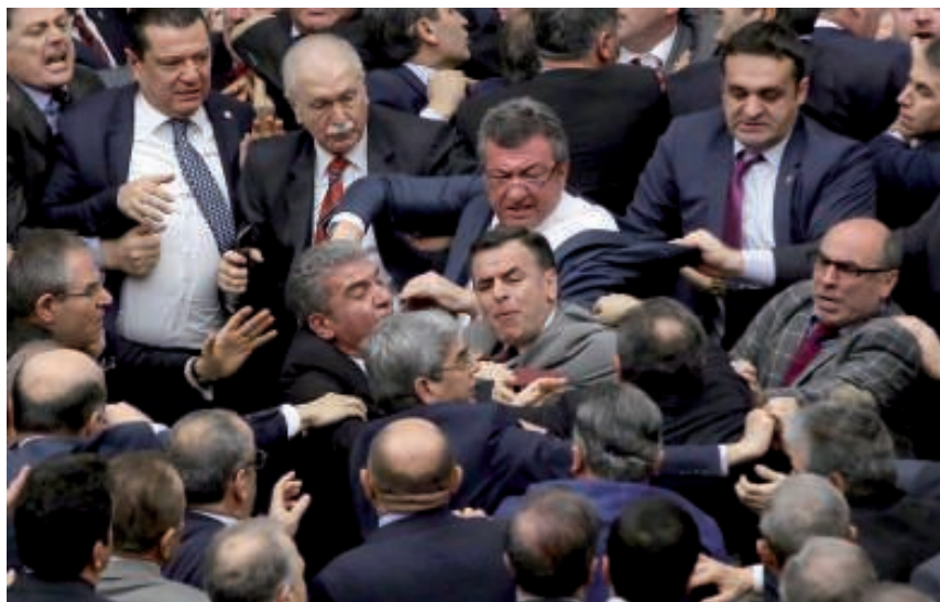
اشتباكات بالأيدي وشجار بين نواب البرلمان التركي بشأن تعديل الدستور، أ ف ب،

تصريحات لوكالة الأناضول الحكومية أن الانتخابات «يمكن أن تنظم في الربيع أو الخريف أو أي وقت». ويفترض أن يتم التصويت على مشروع التعديل الدستوري في قراءتين في غضون أسبوعين. ويجب أن ينال تأييد 330 نائباً ليتمكن عرضه على الاستفتاء الشعبي. ويشغل نواب حزب أردوغان وحزب الحركة القومية الذي يؤيد مشروع التعديل معاً 355 مقعداً. ولم يشارك نواب حزب الشعب الجمهوري في التصويت في حين يقاطع التصويت أصلاً حزب الشعوب الديمقراطي المناصر لقضية الأكراد.