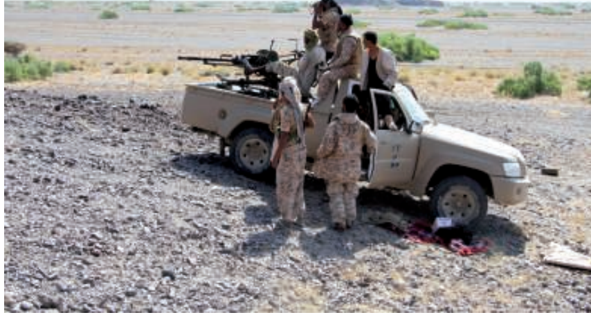
القوات الشرعية خلال معارك مع الحوثيين في منطقة ذباب قرب باب المندب

عدد من ضابط الحرس الجمهوري التابع للمخلوع. وكان طيران التحالف العربي قد