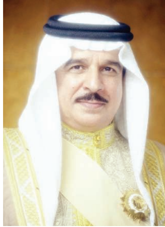
جلالة الملك المفدى

على رئيس مجلس الوزراء والوزراء - كل فيما يخصه - تنفيذ هذا القانون، ويعمل به اعتباراً من اليوم التالي لتاريخ نشره في الجريدة الرسمية.