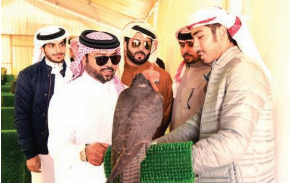
سمو الشيخ فيصل بن راشد آل خليفة مع أحد المشاركين بالمسابقة