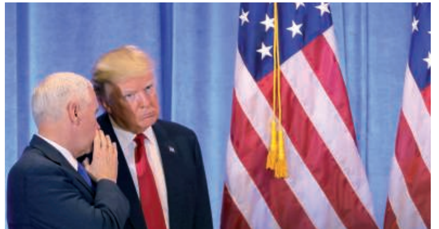
علاقة ترامب ببيتين تثير الشكوك «أ ف ب»

مصدر التقرير الجنسي حول ترامب عميل سابق في الاستخبارات البريطانية