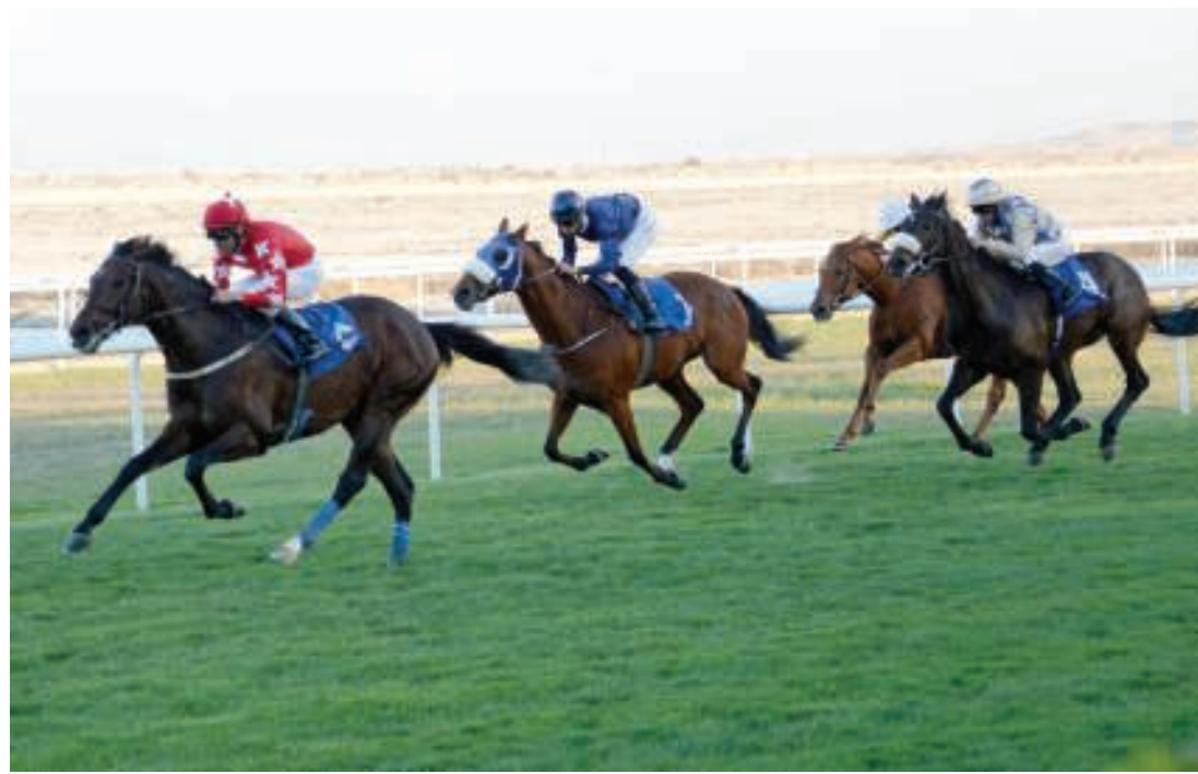
لقطة من سباقات الخيل