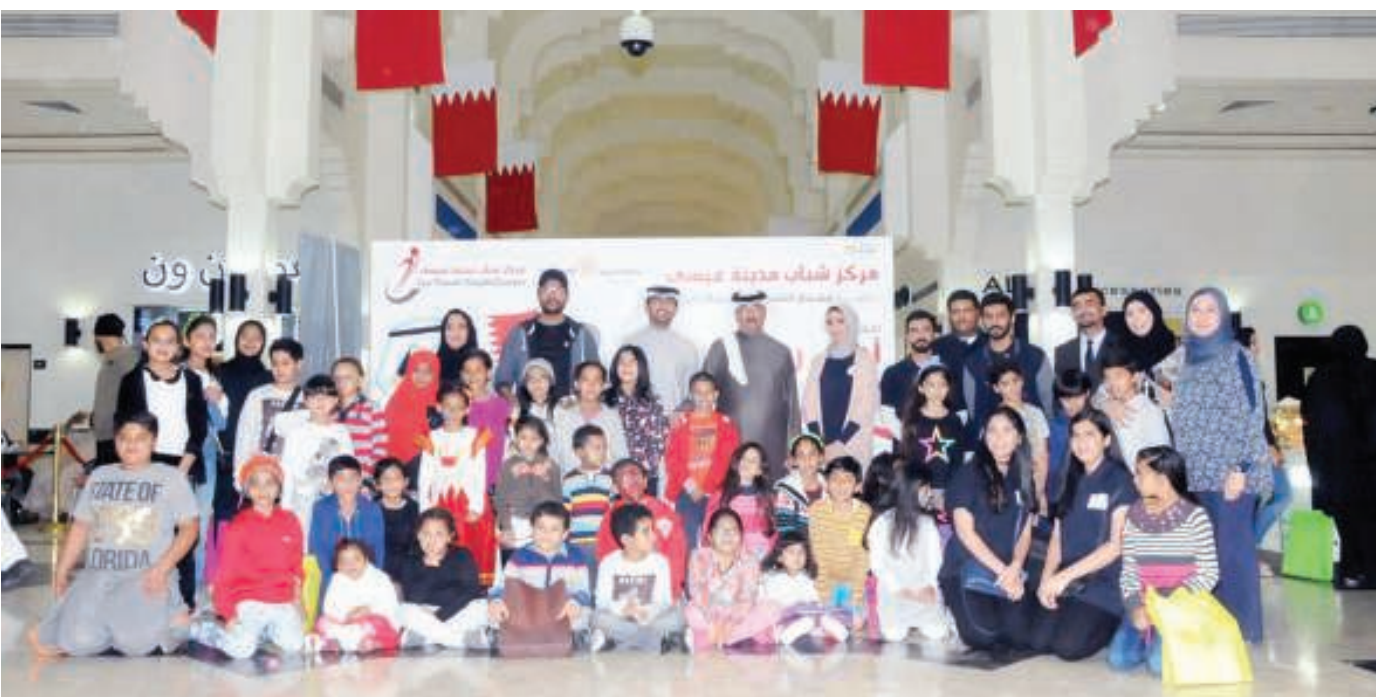
صورة جماعية للطلاب واللجنة المنظمة

حظيت فعالية «أحلى رسمة للوطن» التي نظمتها مركز شباب مدينة عيسى بالتعاون مع مجمع السيف بمدينة عيسى الخميس الماضي بمشاركة مختلفة من أطفال وشباب مناطق مملكة البحرين، الذين بلغ عددهم 160 مشاركاً، حيث تبارى الأطفال في التعبير عن حبهم للوطن من خلال رسومات جميلة ارتسمت ببراءتهم ونقايتهم في التعبير عن حب الوطن والولاء له.