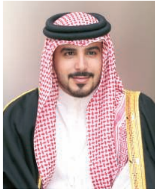
سمو الشيخ محمد بن سلمان بن حمد آل خليفة

وستتجه الأنظار صوب الشوط السابع والأخير الذي سيقام على كأس سمو الشيخ عيسى بن سلمان بن حمد آل خليفة لجياد الفئة الأولى «مستورد» مسافة 1800 متر والجائزة 8000 دينار وبمشاركة 12 جواداً من مجموعة جياد النخبة في المضمار البحريني وتتمتع بإمكانات عالية وسجل حافل بالانتصارات والنتائج المتقدمة سواء في السباقات المحلية أو الخارجية، ويبرز منها الحصان الجديد «شوغن» ملك سمو الشيخ عبدالله بن عيسى بن سلمان آل خليفة وبقية كولم أدنهو والقادم بسمة من سباقات بريطانيا وحقق انتصارات عدة وظهوره اليوم سيعتمد على مدى جاهزيته وتأقلمه مع طبيعة السباقات البحرينية في ظهوره الأول بجانب الحصان الآخر لنفس الإسطبل «أمريكان آر تيس» بقيادة الفارس المعروف هاري بنتلي والمتوقع أن يظهر بصورة أفضل من مشاركته الأولى في السباق الثامن بعد تأقلمه، بالإضافة إلى الحصان «سمين» ملك محمد عبدالرحمن الجسمي وبقية ستيفن لادج والذي يتمتع بسجل حافل وإمكانات عالية وأبرزها فوزه بكأس البحرين الذهبي الموسم الماضي وسيعتمد مستواه اليوم على جاهزيته في مشاركته الأولى هذا الموسم، وكذلك الحصان «ثور كهيل ستار» لإسطبل الناصرية وبقية عبدالله فيصل والذي يتمتع بمستوى جيد وحقق انتصارات آخرها مع نفس الفارس في السباق السابع، والحصان «بروبورد» لإسطبل رمضان وبقية ستيفي دونهو والذي سبق له الظهور بصورة قوية خلال مشاركته الموسم الماضي.