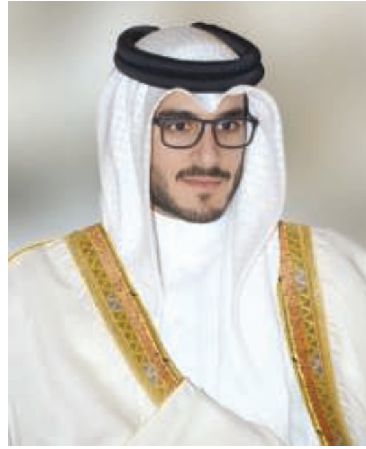
سمو الشيخ عيسى بن سلمان بن حمد آل خليفة