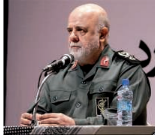
العميد إيرج مسجدي «العربية نت»

ووفقاً لتقارير، يشرف مسجدي حالياً على قيادة ميليشيات الحشد الشعبي، حيث يتلقى كل من هادي العامري وأبو مهدي المهندس «القياديين في الحشد» أوامرهما بشكل مباشر من الجنرال مسجدي، حيث