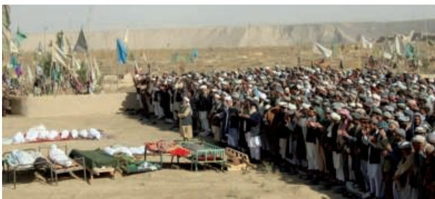
الغارة أوقعت 33 قتيلاً من المدنيين في إقليم قندوز، «رويتز»،

التي وقعت بقندوز في أكتوبر الماضي، وذلك عندما سيطر نشطاء على أجزاء من المدينة. وتسبب سقوط قتلى من المدنيين في حدوث حالة غضب كبيرة، كما أدانت الأمم المتحدة ومنظمات إنسانية أخرى شن الغارة الجوية. من ناحية أخرى، قال رئيس بعثة المساعدة الأممية بأفغانستان في بيان «إن وقوع