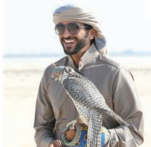
سمو الشيخ ناصر بن حمد آل خليفة

تغطية - المكتب الإعلامي: تحت رعاية سمو الشيخ ناصر بن حمد آل خليفة ممثل جلالة الملك للأعمال الخيرية وشؤون الشباب رئيس المجلس الأعلى للشباب والرياضة رئيس اللجنة الأولمبية البحرينية، تنطلق اليوم منافسات الأسبوع الثاني من النسخة الثالثة لمسابقة البحرين للصقور والصيد، والتي تقام على كأس نجلي سمو: سمو الشيخ حمد بن ناصر بن حمد آل خليفة وسمو الشيخ محمد بن ناصر بن حمد آل خليفة.