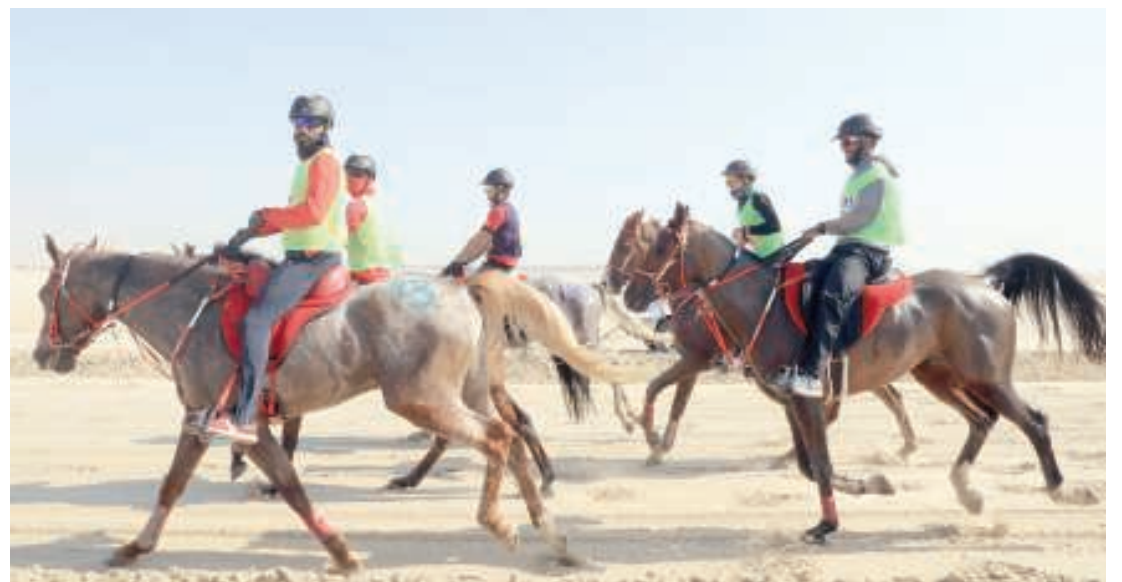
من منافسات البطولة