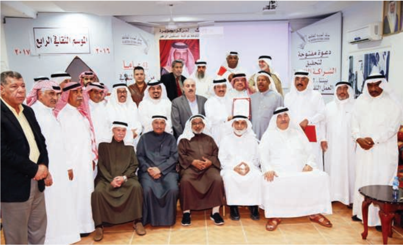
صورة جماعية للحضور في مركز الجزيرة

يؤدي إلى الحصول على أقل الأسعار عند ترسية المناقصة. كما أشار الحمادي أيضاً إلى أن مجلس المناقصات والمزايدات مجلس مستقل يتمتع بشخصية اعتبارية وهو ملحق بمجلس الوزراء حيث يتخذ قراراته بنفسه دون تدخل من أي جهة أخرى، مضيفاً بأن مدة عضوية المجلس سنتان قابلة للتجديد لمرة واحدة. أما فيما يخص العطاءات فقد أشار الدكتور إلى أن فتح مظاريف العطاءات يتم كل يوم خميس بحضور مندوبي الشركات، حيث يتم توزيع نسخة من فتح العطاءات عليهم وذلك لمعرفة جميع الأسعار المقدمة ومعرفة الشركة الفائزة بالمناقصة، منوهاً إلى أنه ليس بالضرورة أن يفوز بالمناقصة من قدم أقل سعراً حيث إن قانون المناقصات يفوز بالعطاء من هو أفضل شروطاً وأقل سعراً، ومعنى الأفضل شروطاً هو من تنطبق عليه كافة الشروط المطلوبة في قانون المناقصات.