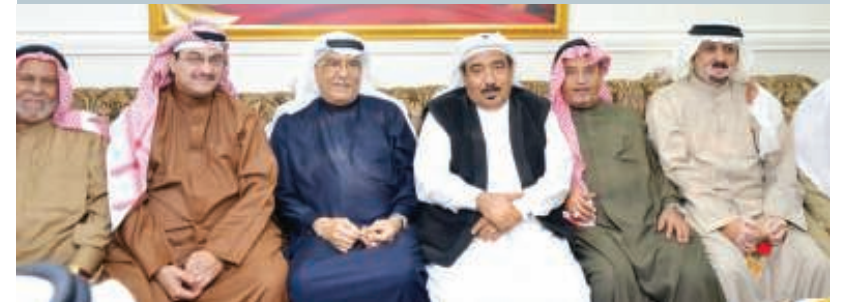
من حضور المجلس