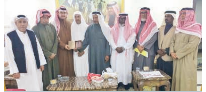
صورة جماعية لبعض الحضور في المجلس