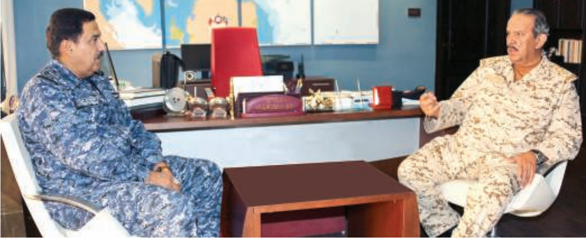
القائد العام متفقداً إحدى وحدات قوة الدفاع

والتدريب المستمر، وأن يعقدوا العزم على أن يغتنموا كل الفرص المتاحة لهم للارتقاء بمستوى العطاء من خلال التطوير العلمي والمهني في ضوء برامج التدريب الداخلية والخارجية. وقال «لنا أن نفخر بأن قوة الدفاع قد تأسست على نهج قويم وراسخ وتمكنت من الحصول على أحدث المنظومات المتقدمة من الأسلحة والمعدات، وقام رجال قوة الدفاع من أبناء الوطن المخلصين بتشيغيلها، وصيانتها بمقدرة وكفاءة عاليتين، والدليل على ذلك الجاهزية القتالية والإدارية العالية لمختلف أسلحة ووحدات قوة الدفاع والأداء الكبير لمنظومتها من أسلحة ومعدات وآليات على مختلف المستويات، والحمد لله على هذا التفيق الذي لازم رجال قوة دفاع البحرين الأوفياء للوطن وللقيادة الرشيدة والذين أثبتوا دائما كفاءتهم في أداء واجبهم الوطني المقدس داخل وخارج البلاد».