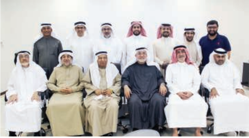
صورة جماعية لمجلس الإدارة الجديد

وأوضح رئيس الإصلاح بأن الجمعية ستعمل خلال الفترة القادمة على وضع مؤشرات كمية ونوعية لكل قطاعات الجمعية لقياس تحقيقها على أرض الواقع خلال الدورة القادمة، وسيأتي على رأس تلك القطاعات القطاع الطلابي والذي يضم أكبر مشروعات الجمعية والمتضمنة واحداث القرآن، والمعالي، والبذور الصالحة وناي الفتيات والتي تعمل مع الطلبة ما قبل المرحلة الابتدائية إلى المرحلة الثانوية من الجنسين، إضافة إلى القطاع الشبابي متضمنا منتدي الجامعيين.