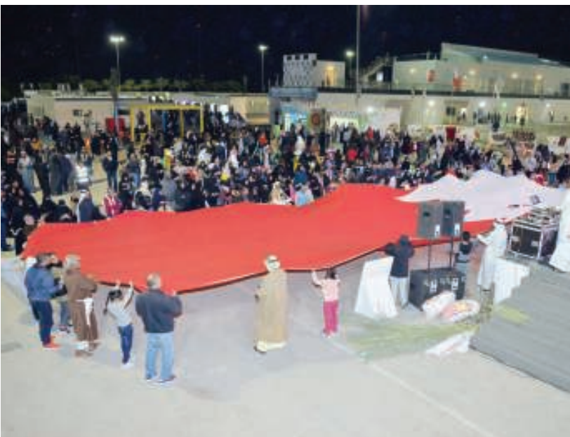
من فعاليات سوق البسطة

الشخصيات الخرافية القديمة التي رسخت في الذاكرة البحرينية والتي أصبحت قصصاً وحزايو تحكى للأطفال في وقتنا الحاضر، إلى تنوع الفعاليات والألعاب المصاحبة ذات الطبيعة التراثية والشعبية التي تعكس عراقاً وأصالة المجتمع البحريني.