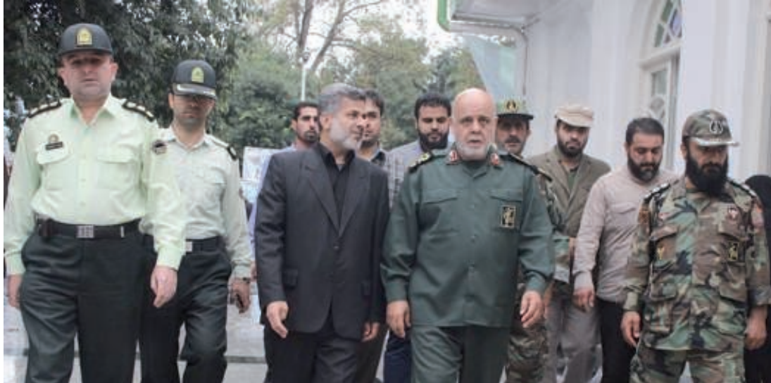
مسجدي مع مسؤولين وقادة عسكريين إيرانيين

يشرف على العمليات الطائفية لـ«الحشد الشعبي»