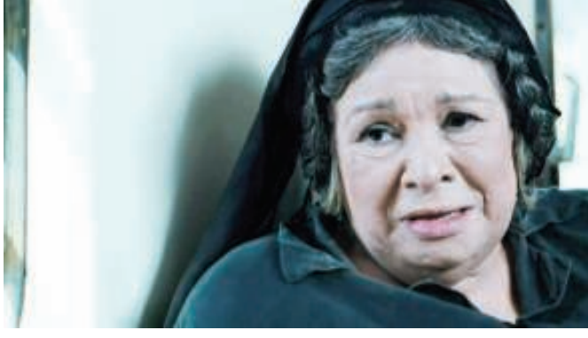
الفنانة كريمة مختار

قالت وكالة أنباء الشرق الأوسط إن الممثلة المصرية كريمة مختار توفيت مساء أمس عن 82 عاماً بعد صراع مع المرض. ونقلت الوكالة عن الفنان سماح الصريطي عضو مجلس نقابة المهن التمثيلية قوله إن جثمان الراحلة سيُشيع من مسجد عمرو بن العاص بعد صلاة الجمعة اليوم.