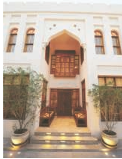
صورة لمركز الشيخ إبراهيم