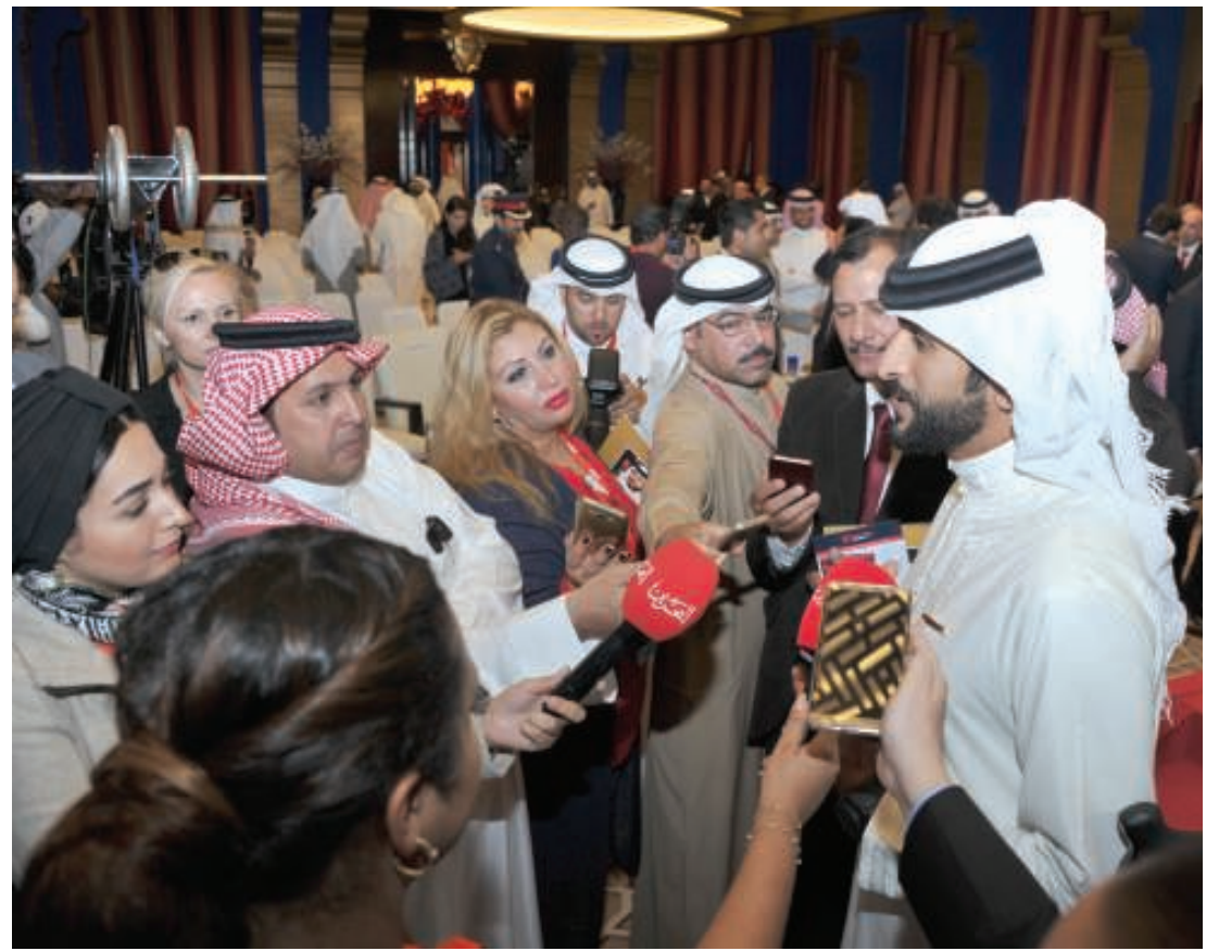
سمو الشيخ ناصر بن حمد آل خليفة يتحدث لوسائل الإعلام

وبيّن سموه أن الأيام المقبلة ستشهد الظهور الأول لفريق البحرين ميريدا للدراجات الهوائية في البطولات الدولية المعتمدة والتي من المؤمل أن